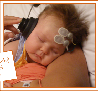
စစ်ဆေးမှုတွေက သင့်ကလေးငယ်ကို မည်သို့မှနာကျင် သို့မဟုတ် အန္တရာယ်ပြုခြင်းမရှိပါ။

အကြောင်းမှာ စစ်ဆေးမှုအများဆုံးကို လျှင်လျှင် စစ်ဆေးမှုအပေါ် အနှောက်အယှက်ဖြစ်စေသည့်အတွက်၊ သင့်ကလေးအိပ်ပျော်နေချိန်၌လုပ်သည်။