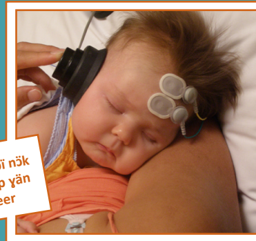
Thēm acī menhdu bī nōk wēlē/ka bī yīen guōp yān tōōk nē geer de kueer

Yekēnē ee acān thēmthēm juēc aaye looi ke menhdu cī nīn, cit ke cāth bī thēm riōök.